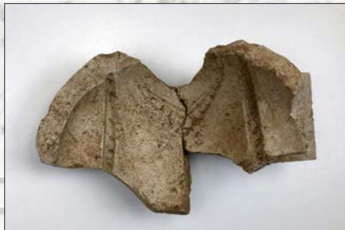
Moule en plâtre d'un buste féminin