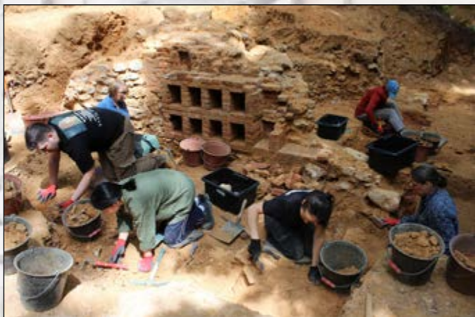
4 e jour de fouilles

La découverte de plusieurs fragments de moules en plâtre révèle la présence d'un atelier de fabrication sur place pour la décoration sculptée de la grotte. Ces moules en creux représentent notamment un buste féminin et un serpent. Ils datent probablement de la création des décors vers 1580, pour la fabrication de bas-reliefs en séries. Ils ont nécessairement été abandonnés lors de la démolition, ce qui indique qu'ils avaient été conservés, peut-être dans cette pièce.