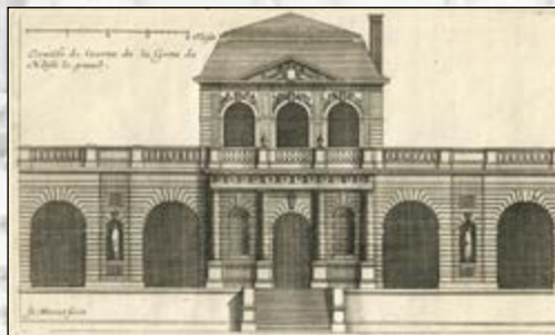
Grotte de Noisy vers 1650 par Jean Marot - cliché Bruno Benz