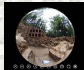
Pièce à alcôve vue intérieure à 360°