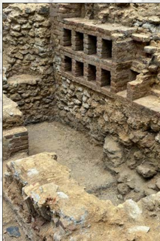
Petites alcôves dans le mur est