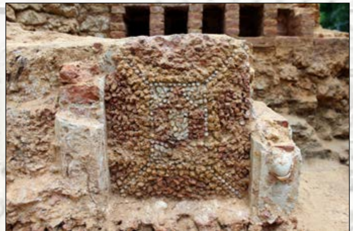
Décor en place dans la salle du portique