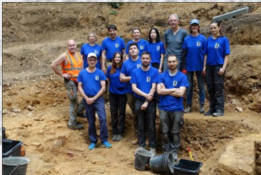
Équipe de fouilles 10.7.24

Fouilles archéologiques - 1 er au 15 juillet 2024