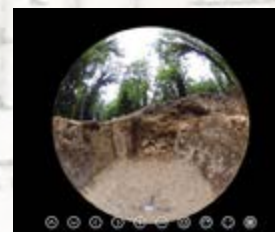
Pièce de service vue intérieure à 360°