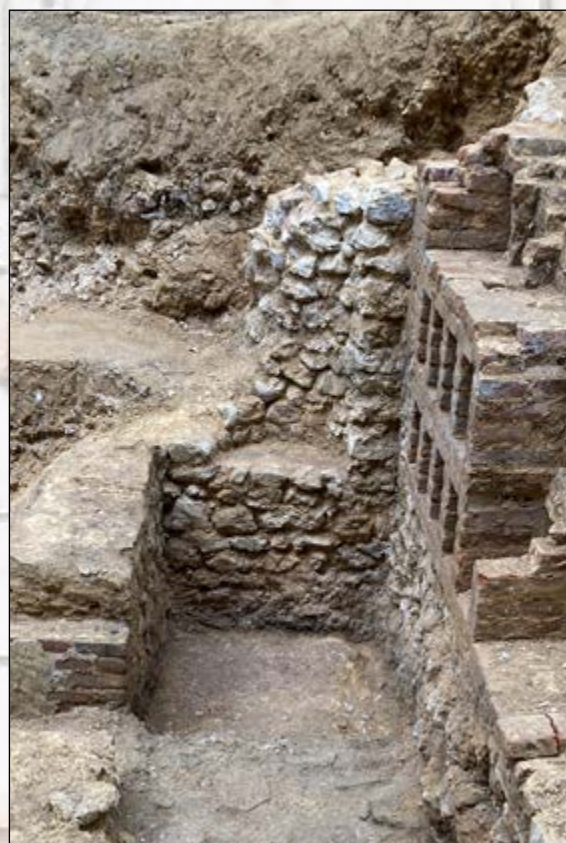
Niche du mur nord